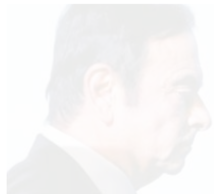
كارلوس غصن سيظهر لأول مرة بعد احتجازه عدا

قال ابن رئيس شركة نيسان المغال كارلوس غصن لصحيفة «جورنال دو ديماش» الفرنسية الاسبوعية، ان الادعاء الياباني يريد من والده ان يعترف بارتكاب مخالفات مالية. وقد تم احتجاز غصن في مركز احتجاز في طوكيو منذ اعتقاله في 19 نوفمبر الماضي بسبب مزاعم عدم الإبلاغ عن دخله في «نيسان موتور» وبواجه أيضاً اتهاماً بارتكاب خرق جسيم للامانة في قضية تحويل خسائر استثمار شخصي إلى حسابات «نيسان» وبغني غصن الاتهامات. ولم تسمح السلطات اليابانية لأنثوني غصن (24 عاماً) برؤية والده الذي قال إنه فقد عشرة كيلوغرامات من وزنه. إذ يتناول 3 أطباق من الأرز يومياً في الاحتجاز. وفي اول مقابلة منذ ان أقت السلطات اليابانية القبض على والده أثناء خروجه من طائرة في الخاصة، قال أنثوني غصن إن والده سيتنازل من أجل إثبات براءته. ويسألونه عما إذا كان والده يتحدث اليابانية، اجاب أنثوني غصن بان والده لا يتحدث اليابانية، مضيفاً: «المفارقة ان الاعتراف الذي يريدونه ان