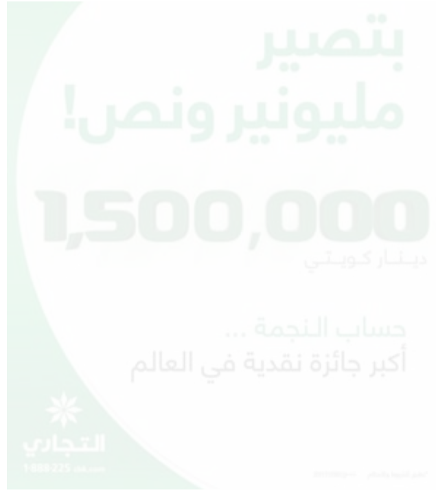
ملصق سحب حساب النجمة