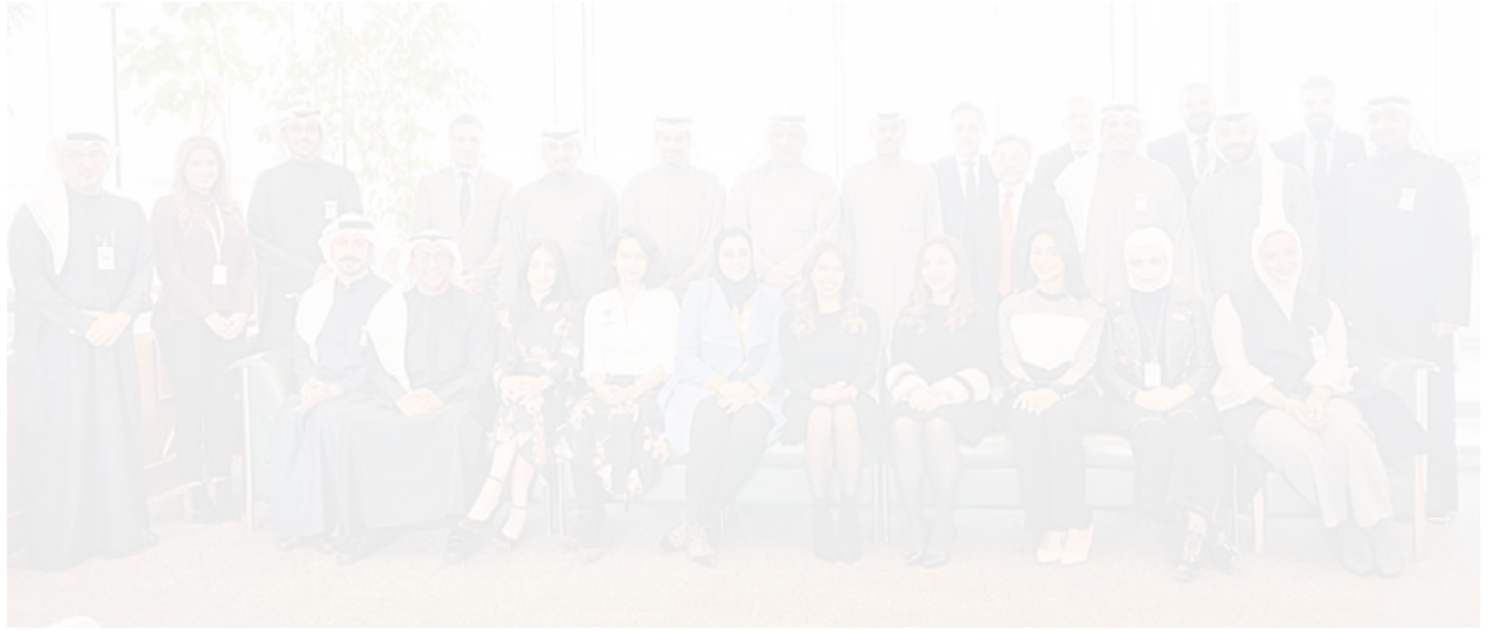
قياديو البنك في حفل تكريم الدفعة العشرين من الموظفين الجدد

احتفى بنك الكويت الوطني بتخريج الدفعة العشرين من الموظفين الجدد في برنامجه السنوي «أكاديمية الوطني» الذي يهدف إلى تطوير وتأهيل الكوادر الوطنية من حملة الشهادات الجامعية حديثي التخرج، واستقبالهم للعمل في القطاع المصرفي وحضر الاحتفال الرئيس التنفيذي لبنك الكويت الوطني - الكويت صلاح الفليح ونائب الرئيس التنفيذي لبنك الكويت الوطني - الكويت سليمان المرزوق وقيادات أخرى من البنك.