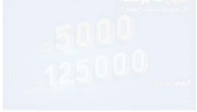
ملصق سحب «يومي»